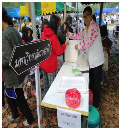
คณะศึกษาศาสตร์