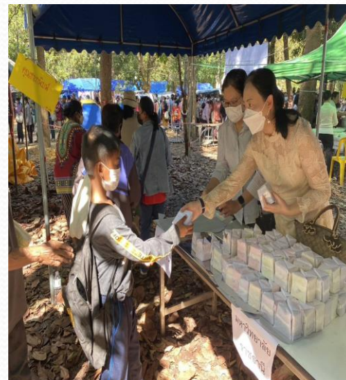
คณะบริหารศาสตร์ คณะวิศวกรรมศาสตร์