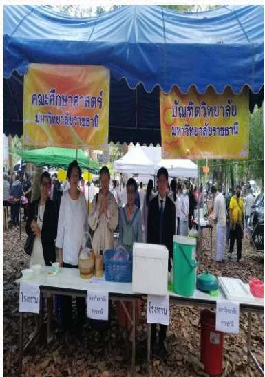
บัณฑิตวิทยาลัย